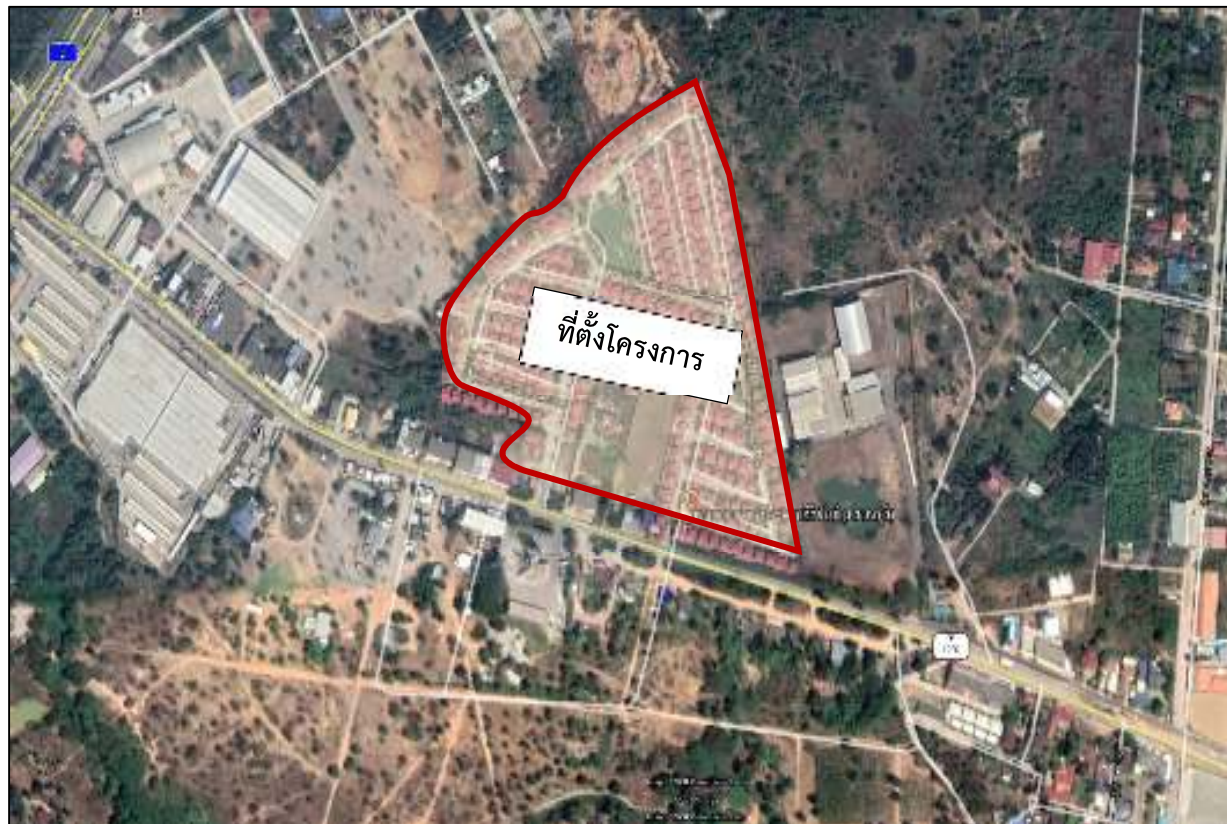
รูปที่ 1.2-1 ที่ตั้งของโครงการ